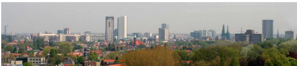
에인트호펜 도시 전경