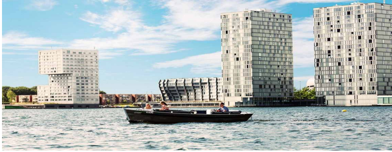
Almere 수변 건축물