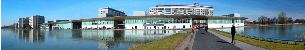
High Tech Campus Eindhoven