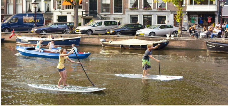
운하에서의 레저 활동